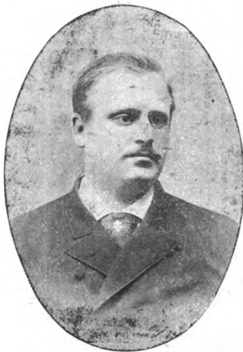
STANISLAS DE GUAITA